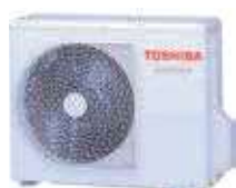
Vonkajšia jednotka (symbolické znázornenie)